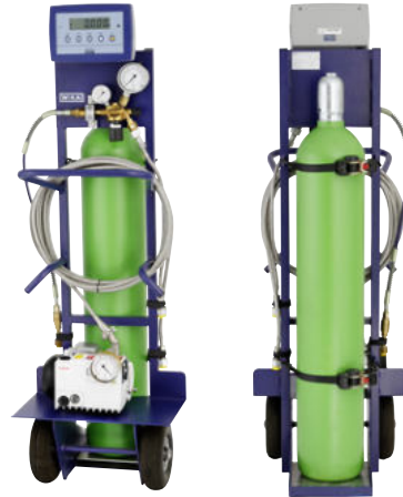
Abb.: Typ GFU08-C